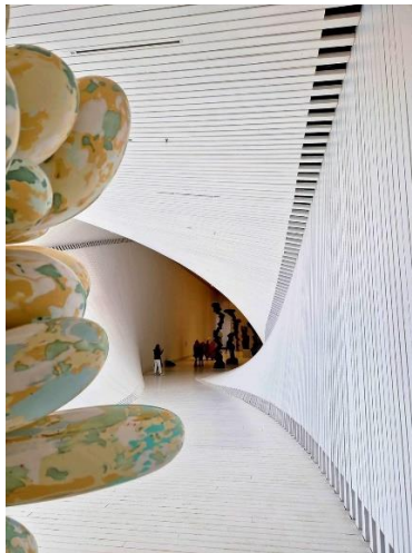
The Twist, interior