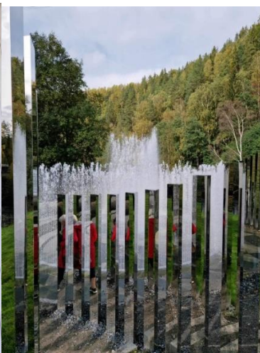
Vägen till frihet, Jeppe Hein, Skulpturparken Kistefos